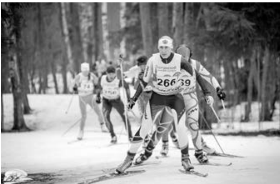
Лидер среди участниц 30 км на дистанции