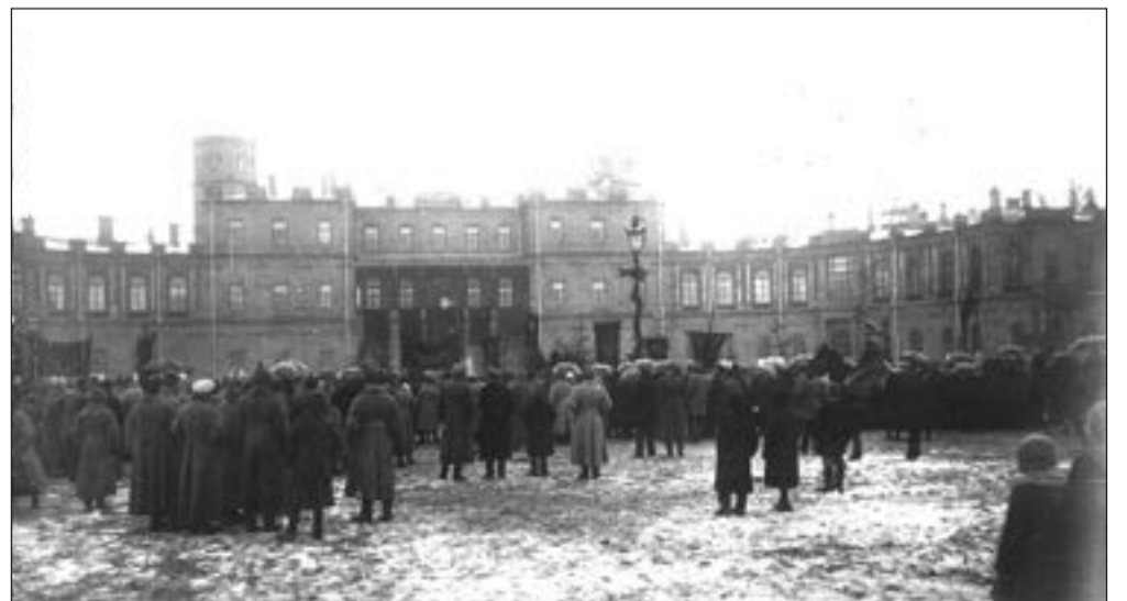
Торжество по поводу переименования г. Гатчины в Троицк. 1923 г.