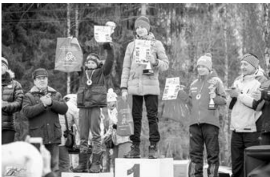
Юные победители 38 Гатчинского лыжного марафона. Дистанция 10 км