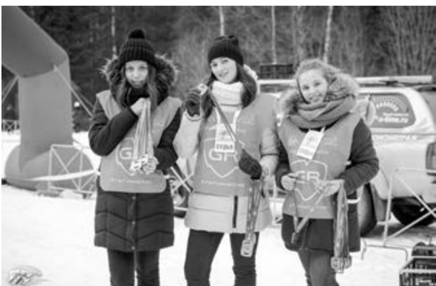
Перед вручением финишерских медалей