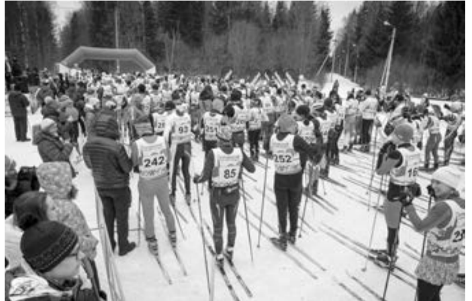
Подготовка к старту на 50 и 30 км