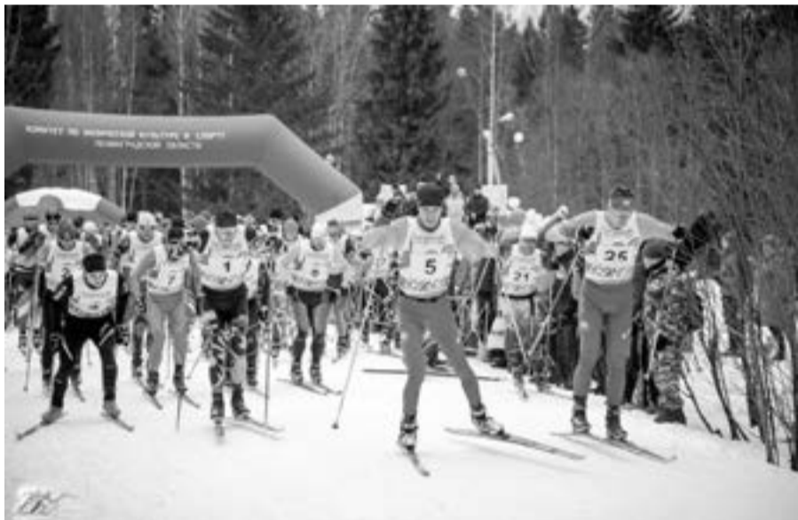
Старт гонки на 30 и 50 км