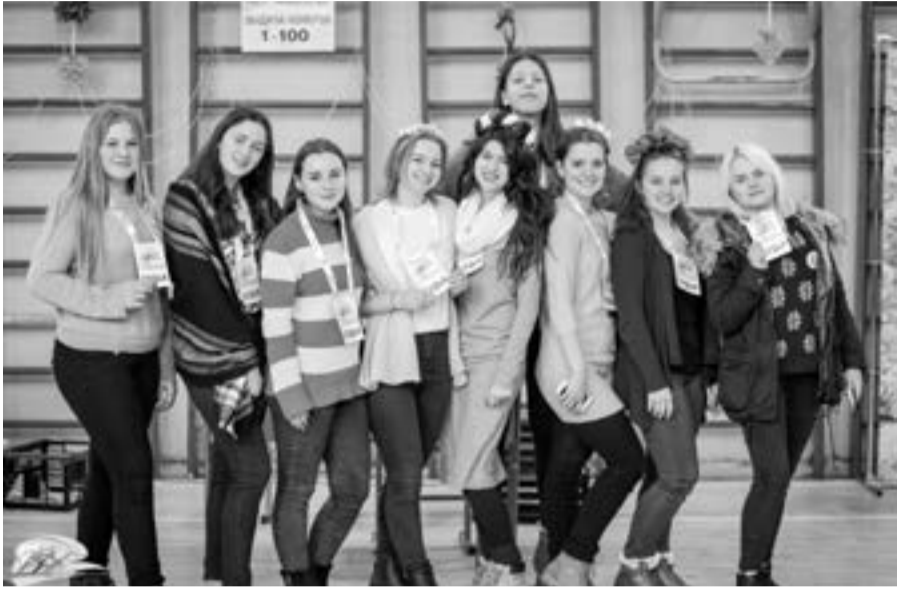
Волонтеры в Гатчинском лицее №3. Зона выдачи номеров участникам 50 и 30 км