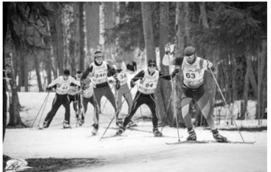
Участники марафона на дистанции