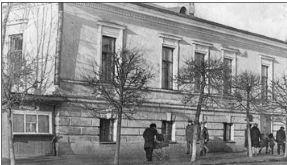
Здание прокуратуры по адресу Красная, 16. 1970-80 гг.