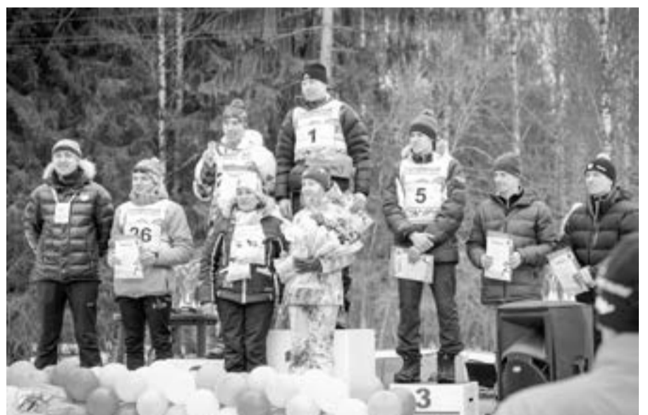
Шестерка сильнейших мужчин 38 Гатчинского лыжного марафона