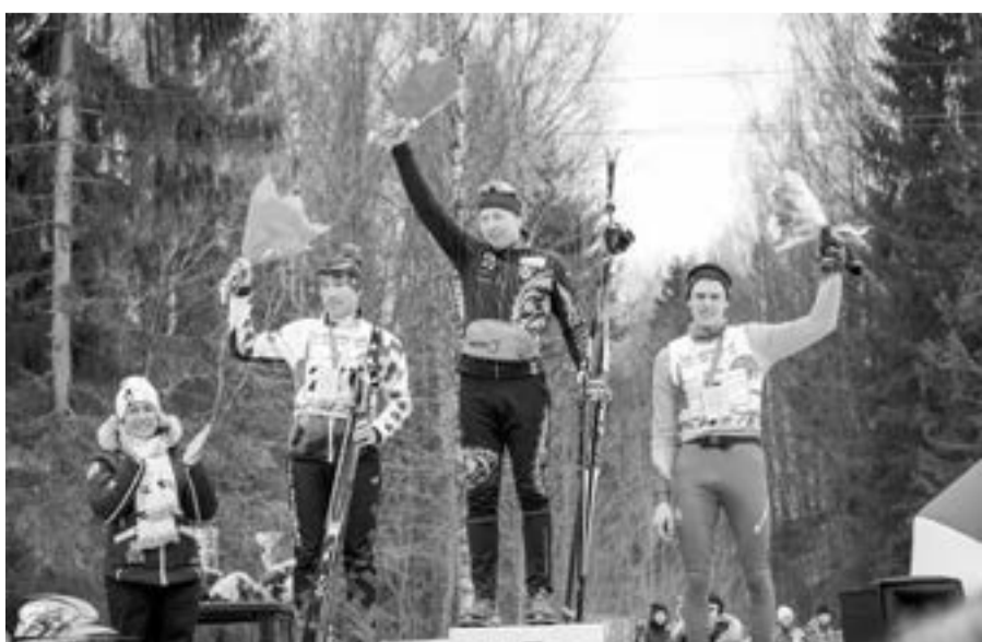
Цветочная церемония победителей 50 км среди мужчин