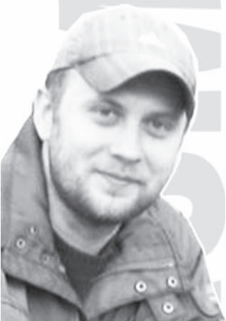
Ковровых дел мастер, специалист по ворсу.

Заметка моя в высшей степени легкомысленная и ветреная, такая же как весна. Просто, чтобы уйти от груза ответственности нашего бытия и позволить себе быть другими, ну хотя бы этой весной.