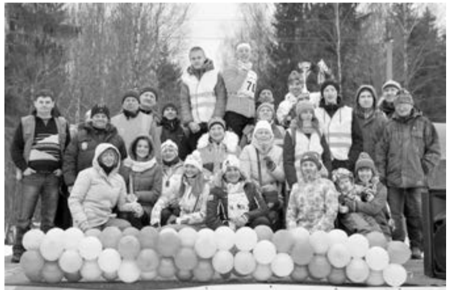
Команда организаторов 38 Гатчинского лыжного марафона