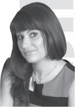
Преподаватель английского языка.

невероятной любви к Жизни. К бесконечному стремлению Жить! Жить, во что бы то ни стало. Какой бы холодной зима не была! Радоваться всем сердцем, этой особенной способности, внутри себя и всего живого – к победе Жизни над небытием! Радоваться этой неизбежности вокруг... Тому, что написано где-то вне наших книг и вне нашего понимания. Тому, что читается, исключительно, чувствами, сердцем, душой, воспоминаниями, моментами, фрагментами, отблесками... И после, также неизбежно, складывается в откровение, новый росток внутри, в понимание, в строчку, в признание, в новый шаг. Шаг навстречу. Шаг навстречу новой Весне!