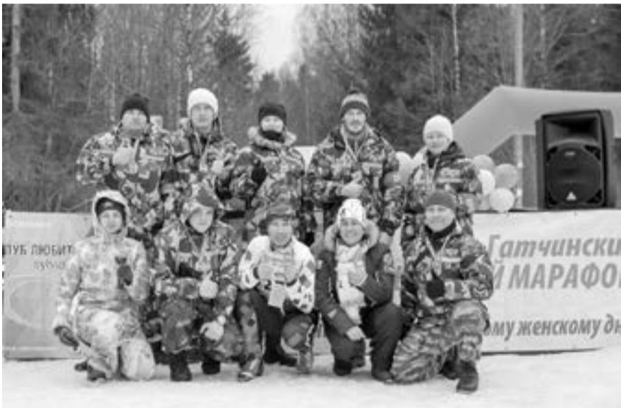
Гатчинская добровольная народная дружина на страже порядка 38 Гатчинского лыжного марафона